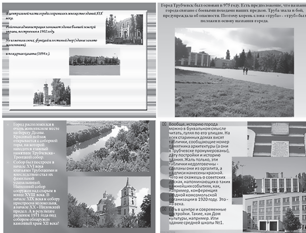
Рис. 2. Презентации проектов на тему «Памятники нашего города»

Заданием на творческий проект является создание символа герба нашего города (использование программы Scratch или Tux Paint).