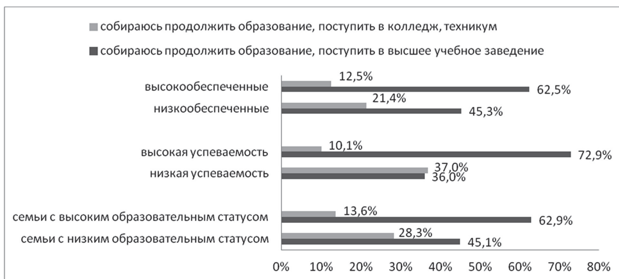
Рис. 2. Влияние различных факторов на образовательные планы учащихся после окончания школы (%).

2. Профессиональные ориентации школьников. Результаты ответов школьников на специальный вопрос об их предпочтениях в отношении различных сфер профессиональной деятельности показывают, что в среднем наиболее предпочитаемой сферой профессиональной деятельности является «спорт» (31,4%). На втором по частоте выборов месте находится «культура и искусство» (26,6%); на третьем – «экономика» (18,7%); четвертое место занимает «образование» (17,2%), а пятое – «интернет-сфера (блоггинг, продвижение сайтов, интернет-торговля и т.д.)» (см. таблицу 2).