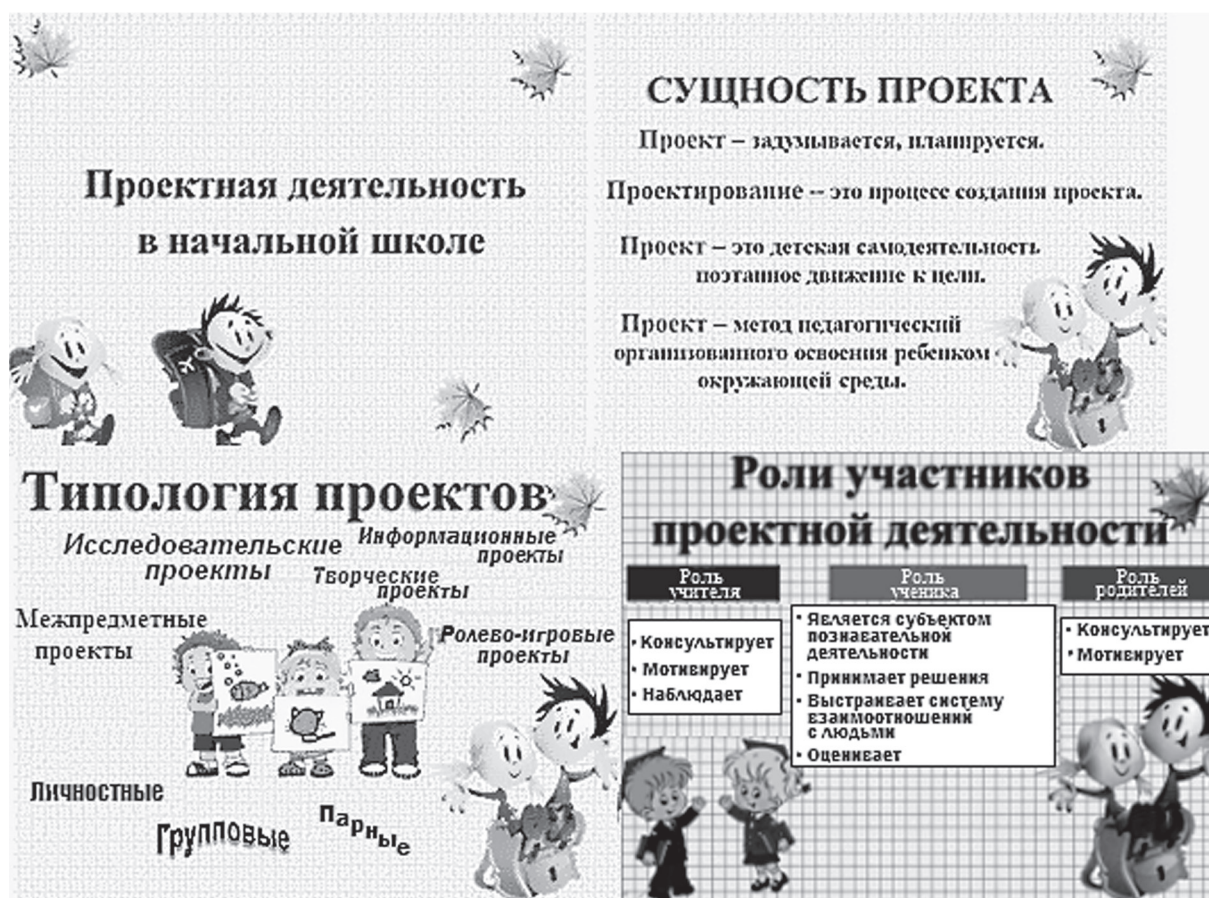
Рис.1. Презентация «Проектная деятельность в начальной школе».

2. Проект «Питайся правильно!» – чтобы быть здоровым необходимо правильно питаться, поэтому в рамках данного проекта были рассмотрены следующие вопросы: