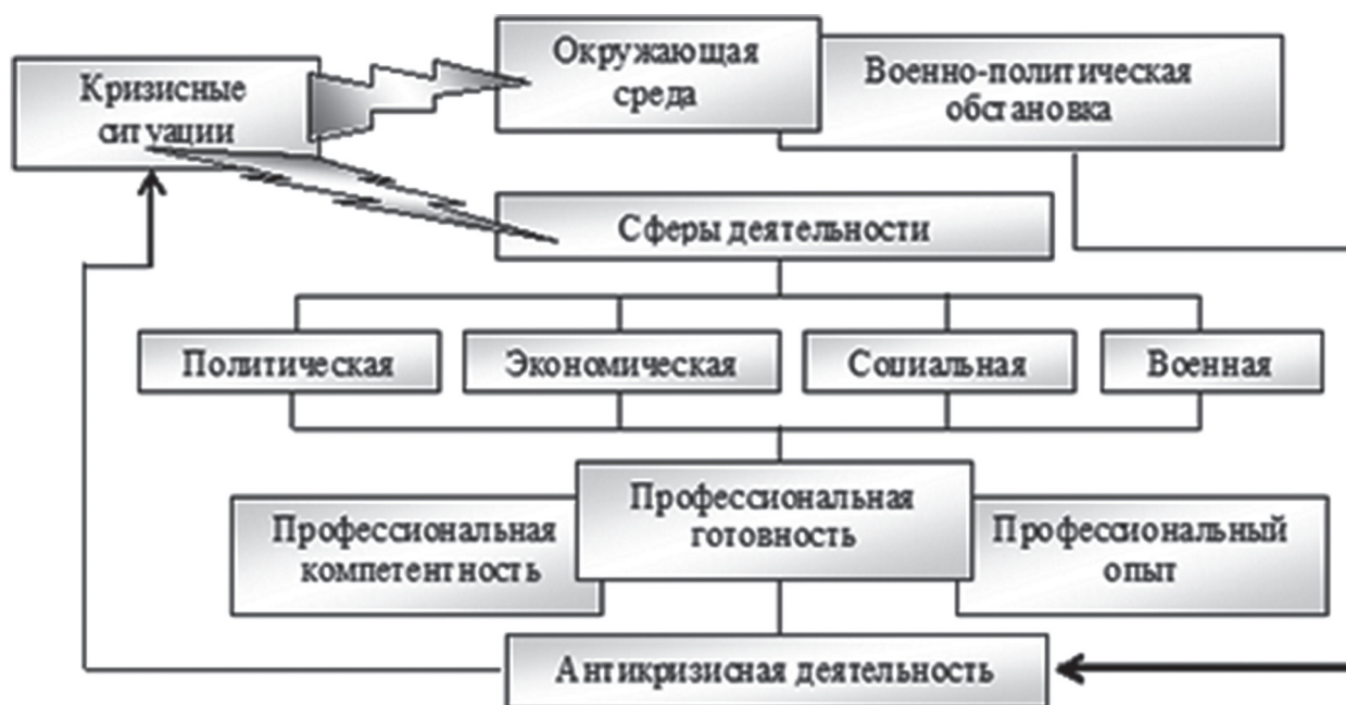
Рис. 1. Структура готовности военного специалиста к профессиональной деятельности в кризисных ситуациях.

званные составляющие необходимо развивать в разрезе подготовки офицера к руководству многонациональными воинскими коллективами, многочисленными и сложными по составу. Офицеру предстоит работать с представителями других государств, наций, этносов. Осуществлять эту работу следует деликатно и профессионально, соблюдая и грамотно применяя международное право, принципы и традиции межгосударственных отношений, а также приобре-