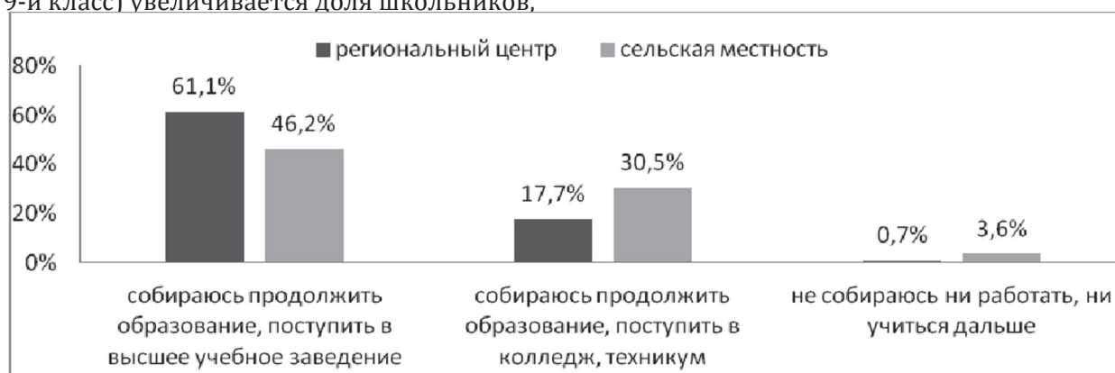
Рис. 1. Специфика планов после окончания школы учащихся из разных типов поселений (%).

Материалы исследования дают основания утверждать, что планы учащихся на будущее после окончания школы тесно связаны с рядом социально-стратификационных факторов. Так, например, выраженные различия проявляются в специфике планов у городских и сельских школьников (см. рисунок 1).