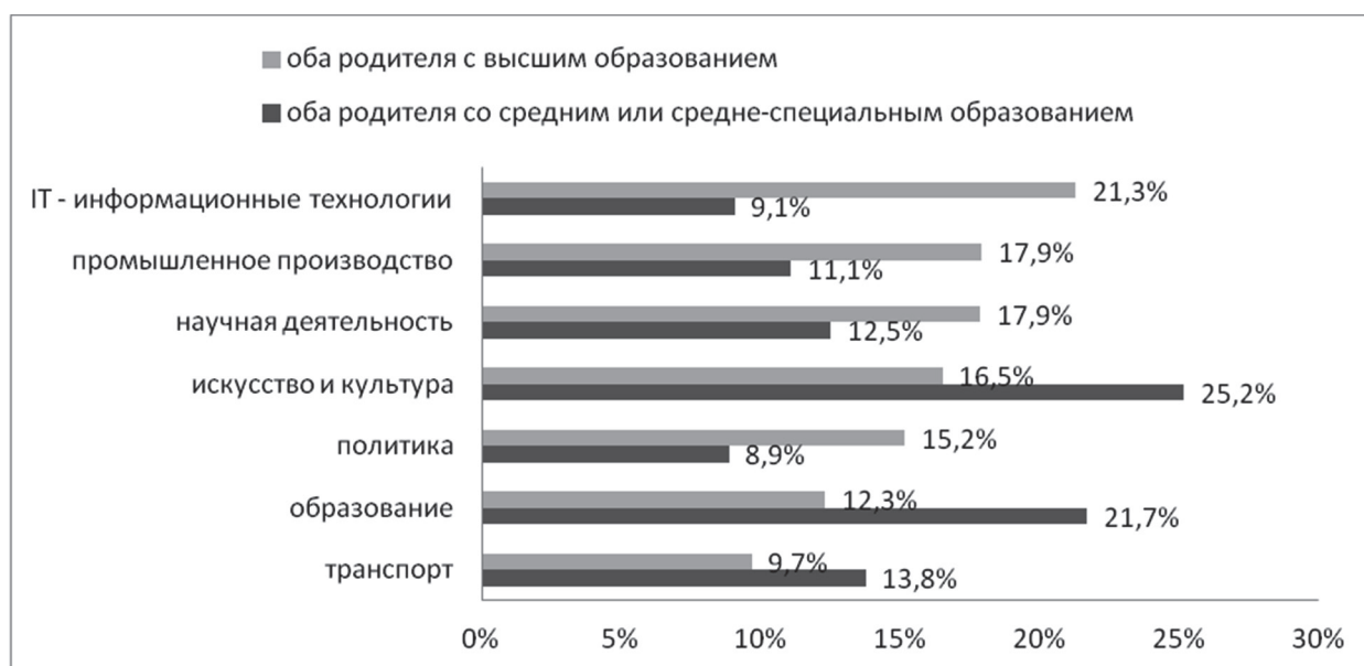
Рис. 3. Влияние образования родителей на профессиональные ориентации учащихся* (%)

«образование», «экономика», «массовая коммуникация», «политика». Необходимо отметить, что академическая успешность школьника складывается из оценок и не является просто числовым выражением качества образования конкретного ученика, за самим понятием успеваемость стоит масса социально-психологических явлений, отношений, особенностей возраста и социализации ребенка [11]. Тем не менее качество образования (если речь идет об образовательном учреждении) или образованность отдельно взятого ученика, как правило, традиционно оценивается по результатам его обучения, выражающимся в среднем балле успеваемости (троечник, хорошист, отличник) или баллах итоговых аттестаций ОГЭ/ЕГЭ. Исходя именно из этих оценок, школьники и выстраивают для себя некоторый образ будущего. Таким образом, можно говорить и о роли школы как социального института в выборе учащимися дальнейшего профессионального пути. В этом смысле «педагогический неуспех» школы если и не предопределяет выбор учащимся определенной профессиональной траектории, то во всяком случае ориентирует его на поиск альтернативной стратегии самореализации, в которой академическая успешность не будет играть доминирующей роли.